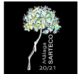
(b) Logo Jornadas